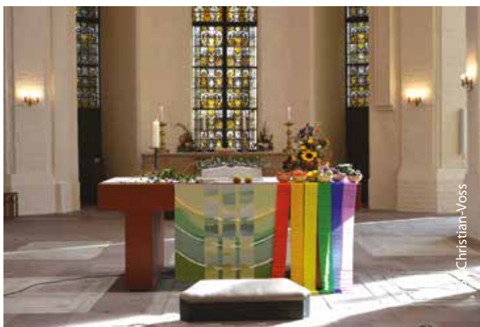
Beim Gemeindeausflug 2025 in der Petrikirche in Wolgast

Genauere Angaben bekommen Sie dann rechtzeitig in unsrem Newsletter und der Herbstausgabe der EIS.