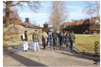
Unsere Gruppe betritt das ehemalige Konzentrationslager Auschwitz.

Wir bedanken uns herzlich für die Förderung und für die Ermöglichung dieser Fahrt bei der Europäischen Akademie Mecklenburg-Vorpommern, dem KJP des Bundes und der IBB gGmbH.