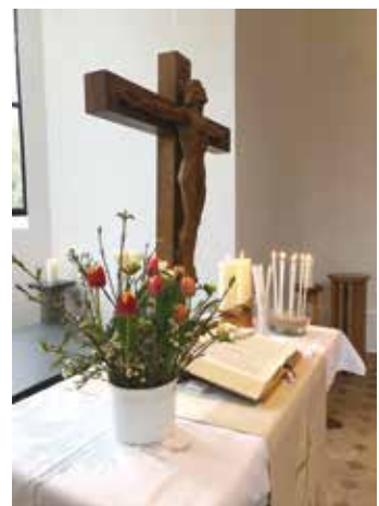
Altar zur Wochenschlussandacht in der Schlosskapelle Parow

zeit über unser Mobiltelefon erreichbar und haben Zeit für seelsorgerliche Gespräche, für deren Inhalt immer Verschwiegenheit gilt.