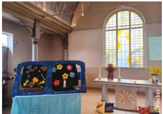
Ostersonntag in der Lutherkirche