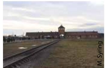
Dieses Motiv kennen viele: Vernichtungslager Birkenau