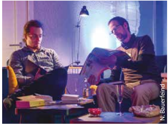
Eröffnungslesung in der Open-Öhr-Kulturwerkstatt