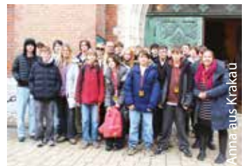
Vor der Marienkirche in Krakau