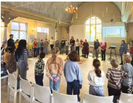
Weltgebetstag mit Kindern