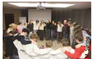
Am letzten Abend wurde israelisch getanzt: „Hevenu Shalom“.